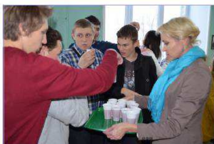
От сессии до сессии живут студенты весело.