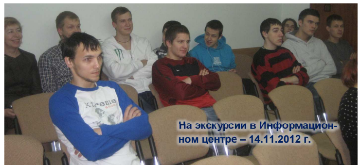
На экскурсии в Информационном центре – 14.11.2012 г.

Еще одну ступеньку взрослой жизни Сегодня одолели вы успешно, Удача ласкова, но очень уж капризна Пусть улыбнется вам, Красиво и неспешно. Пусть вы найдете себя, свое призванье, Ведь это очень важный в жизни шаг, Пусть успешным будет ваше начинанье, Пусть вздымается счастливой жизни флаг!