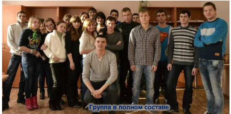
Группа в полном составе

Еще одну ступеньку взрослой жизни Сегодня одолели вы успешно, Удача ласкова, но очень уж капризна Пусть улыбнется вам, Красиво и неспешно. Пусть вы найдете себя, свое призванье, Ведь это очень важный в жизни шаг, Пусть успешным будет ваше начинанье, Пусть вздымается счастливой жизни флаг!