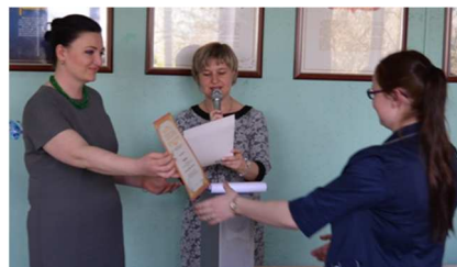
На фото: чествование студентов.