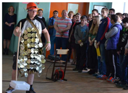
На фото: представление защитного костюма учителя от студентов

Стипендиальная комиссия должна будет провести отбор самых – самых и определить стимулирующие выплаты.