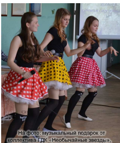
На фото: музыкальный подарок от коллектива ГДК «Необычайные звезды», руководитель А. Мутовина.