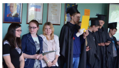
На фото: студенты колледжа и преподаватели.