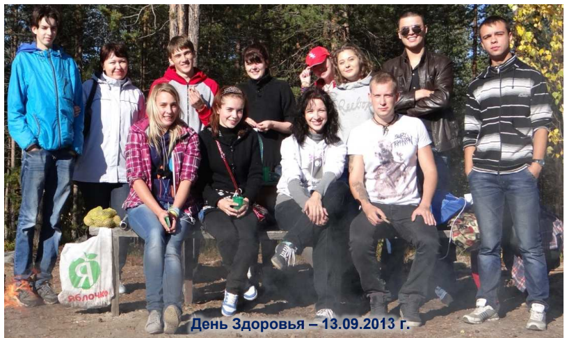
День Здоровья – 13.09.2013 г.

Мы благодарность шлём учителю за терпеливый к нам подход. Подобно мудрому воителю, что новичков ведёт в поход. Вы нас учили очень многому, открыли нам глаза на мир. Теперь нелёгкими дорогами пойдём, имея ясный смысл. Порой мы слепы были, что уж там. Повязки с наших глаз срывали вы. Тихонько, каждый раз всё по своим следам вели нас к знаниям, К покореньям высоты.